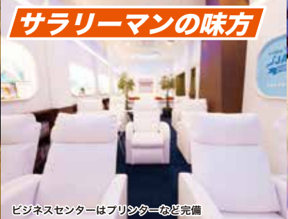
ビジネスセンターはプリンターなど完備