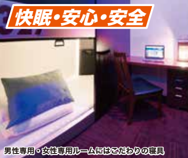
男性専用・女性専用ルームにはこだわりの寝具