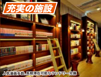
人気漫画多数、長期滞在可能なランドリー完備