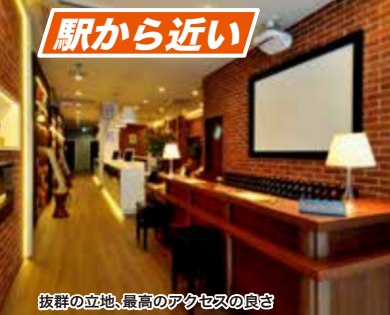
抜群の立地、最高のアクセスの良さ